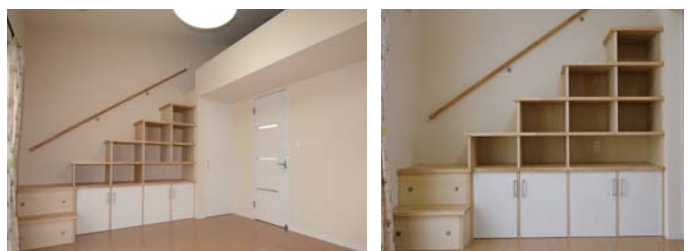
キッズルーム&ロフト

電話、FAX、レターセットなど、家族みんなが使うものをリビングカウンターに集約。時には、子どもたちのお絵かきスペースに早変わり。