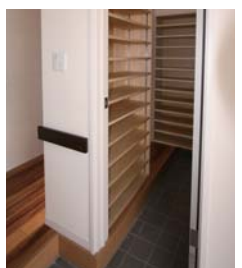
シューズ・イン・クローク

床の木目にマッチするダイニングテーブルをコーディネート。やわらかな光の下で、おいしい料理に舌鼓。