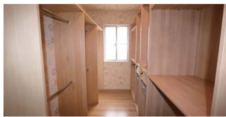
ウォーク・イン・クローゼット

オーダーメイドのベッドボードは間接照明にこだわりました。やさしい灯りでライトアップします。一日の終わりに心からリラックスしたひとときを過ごせます。